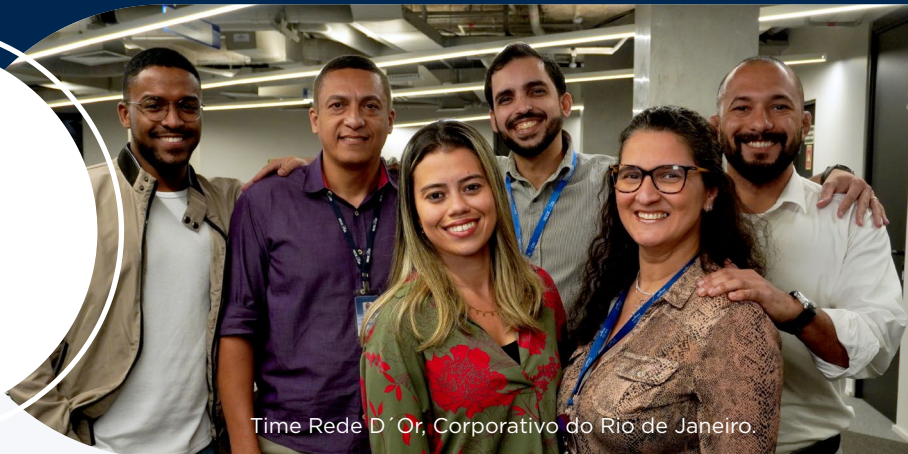
Time Rede D'Or, Corporativo do Rio de Janeiro.