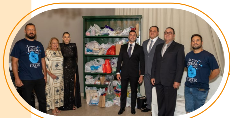
Alimentos arrecadados em Mato Grosso do Sul