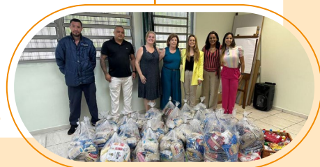
Alimentos arrecadados em São Paulo