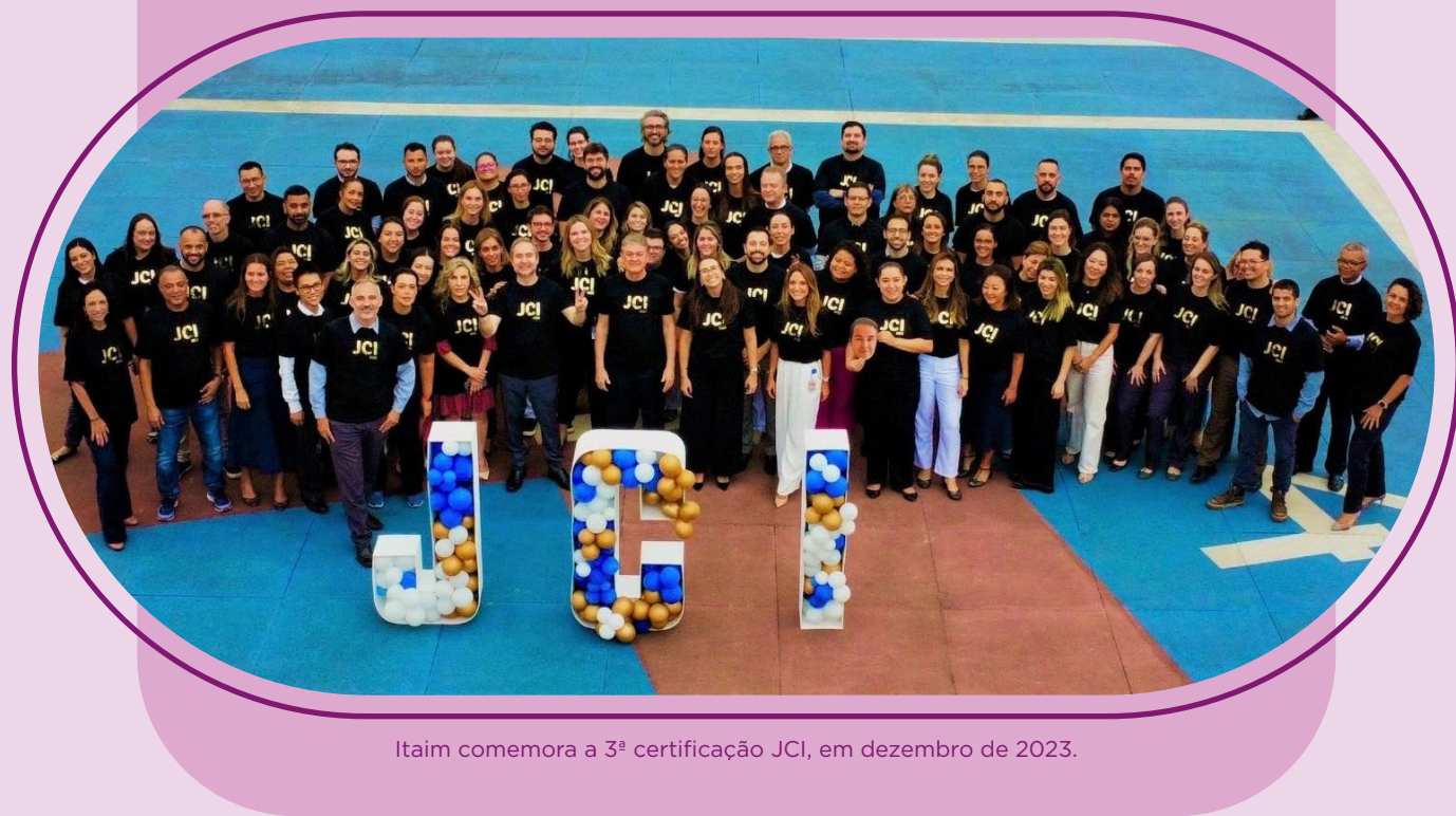
Itaim comemora a 3ª certificação JCI, em dezembro de 2023.

A conquista da acreditação é um compromisso com a alta qualidade, segurança e humanização no atendimento e no cuidado com o paciente.