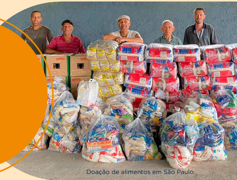
Doação de alimentos em São Paulo

Nas confraternizações do final de 2023 das equipes médicas, a Rede D'Or fez um convite para doação de alimentos não perecíveis. Foi o primeiro ano dessa ação e o resultado superou as expectativas: 5.196 toneladas de alimentos para distribuição em instituições indicadas pelas diretorias e pela área de Sustentabilidade, validadas pelo Compliance .