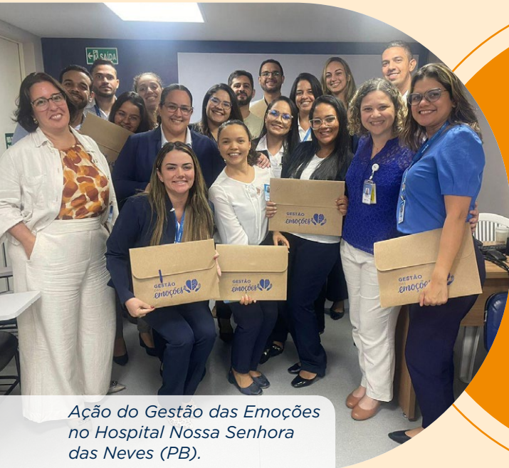
Ação do Gestão das Emoções no Hospital Nossa Senhora das Neves (PB).