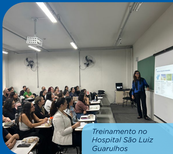
Treinamento no Hospital São Luiz Guarulhos

No dia 1º de agosto, os times do Hospital São Lucas Macaé (RJ) tiveram um treinamento sobre Desenvolvimento Sustentável . Nos dias 8 e 22 de agosto, foi a vez dos colaboradores que farão parte do novo Hospital São Luiz Guarulhos, em São Paulo . Além disso, em 15 e 23 de agosto, o Hospital São Luiz Alphaville , também em São Paulo, recebeu o treinamento. E a agenda não para por aí. Em setembro e outubro, estão previstas outras rodadas de encontros com os novos colaboradores das unidades Guarulhos e Alphaville.