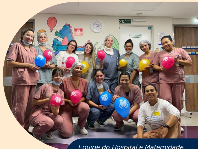
Equipe do Hospital e Maternidade Brasil (Santo André - SP) em atividade do Gestão das Emoções.

A campanha deste ano inclui ações como um webinar nacional voltado a todos os colaboradores da Rede D'Or, encontros com as equipes de Saúde e Segurança Ocupacional (SSO) com o intuito de fortalecer as habilidades de acolhimento, atendimento e condutas frente ao paciente com adoecimento mental, mobilizados pelo time de SSO Corporativo, além de atividades locais organizadas pelos times de Recursos Humanos e SSO das unidades, como dinâmicas de troca de mensagens de acolhimento entre colaboradores(as), encontros e palestras.