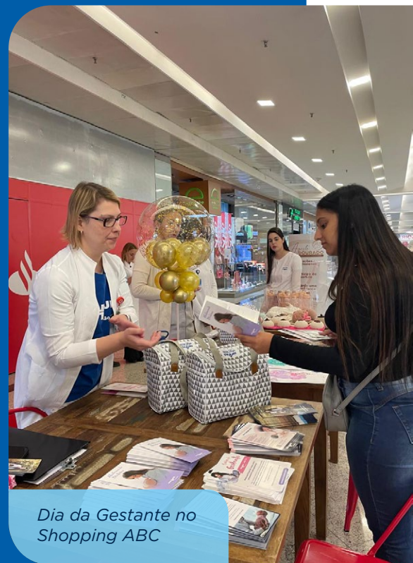
Dia da Gestante no Shopping ABC

Outras ações de conscientização também se destacaram. Os hospitais Vivalle (SP) e Anália Franco (SP) conduziram rodas de conversa e a Maternidade São Luiz Star (SP) realizou dois webinars com a participação de especialistas, que falaram sobre uma abordagem diversa e inclusiva na amamentação .