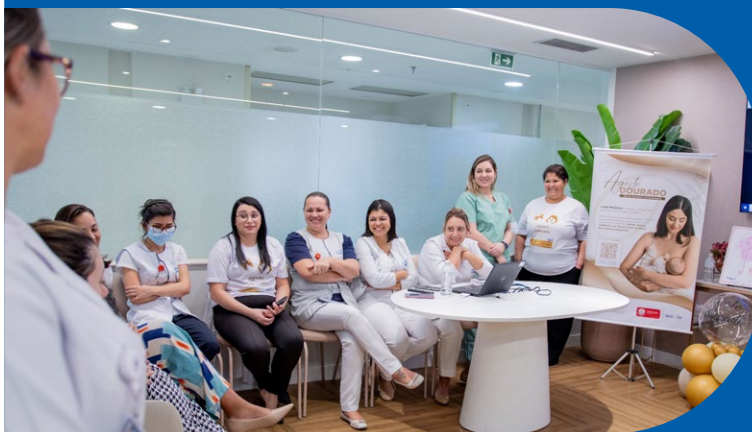
► Agosto Dourado no Hospital Anália Franco