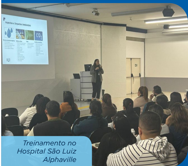
Treinamento no Hospital São Luiz Alphaville

Os treinamentos são um exemplo de avanço do engajamento das nossas unidades para além dos meios digitais e de comunicação formal, reforçando o compromisso da empresa com práticas responsáveis e o desenvolvimento sustentável em toda a nossa rede .