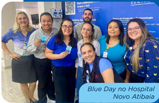
Blue Day no Hospital Novo Atibaia