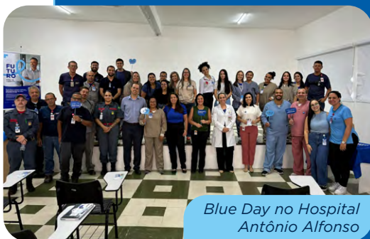
Blue Day no Hospital Antônio Alfonso

De acordo com dados do Instituto Nacional do Câncer (INCA/2024), “no Brasil, estimam-se 71.730 novos casos de câncer de próstata por ano para o triênio 2023-2025”. O câncer de próstata é o segundo mais frequente e letal entre homens no Brasil, depois do câncer de pele.