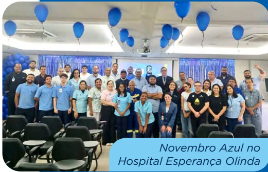
Novembro Azul no Hospital Esperança Olinda