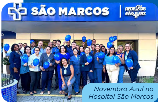
Novembro Azul no Hospital São Marcos